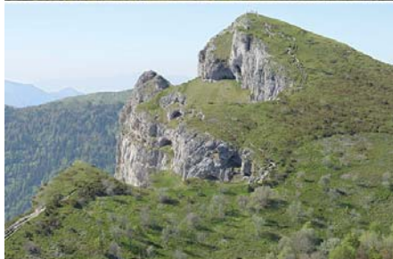
Observatoire photographique du paysage de la forêt de Saoû