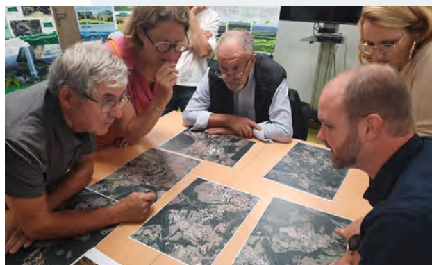
▲ Atelier n°2 : les élus réfléchissent à l'impact paysager d'un projet d'aménagement, après avoir pris connaissance de l'exposition Paysages mobilisés - Récit des paysages d'Ardèche perçus par les habitants . Cette exposition a été réalisée par le CAUE de l'Ardèche, en partenariat avec le Cermosem et le Parc naturel régional des Monts d'Ardèche.