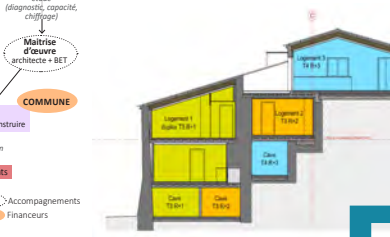
↑ L'implantation du projet dans la pente et la superposition des logements.