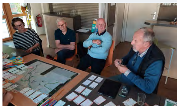
▲ Atelier n°1 : les élus échangent et réfléchissent collectivement à un projet communal grâce à l'outil Ma commune à la carte . Ce dernier a été conçu et diffusé par le CAUE de Meurthe-et-Moselle, en partenariat avec le Syndicat mixte de la Multipole Nancy Sud Lorraine.