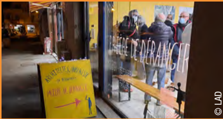
▲ Un lieu de résidence pour l'équipe en charge de la programmation propice à discuter avec les habitants et à imaginer ensemble les espaces publics de demain