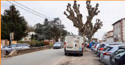
▲ Une traversée routière peu accueillante pour les piétons