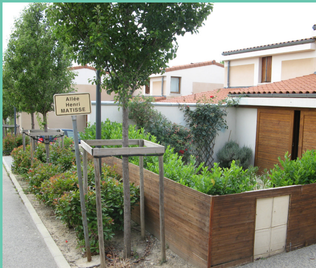
▲ Le lotissement La Salière à Étoile-sur-Rhône présenté aux collégiens