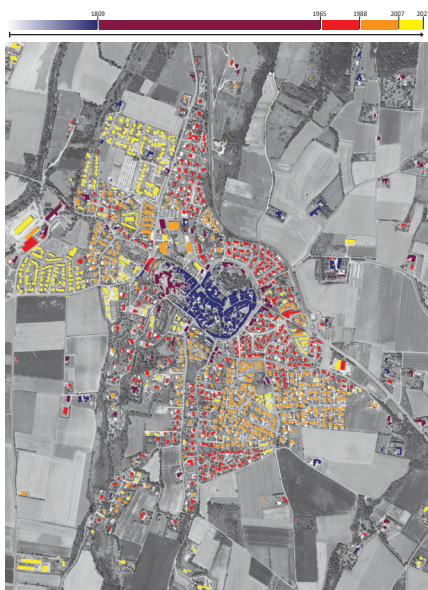
▲ Carte de l'évolution urbaine de la commune d'Étoile-sur-Rhône présentée aux collégiens