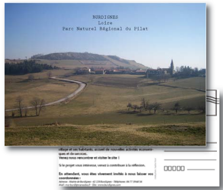
L'appel à candidature

Pour protéger l'agriculture locale très dynamique, la commune de Burdignes souhaite développer un nouveau quartier d'habitation sur une parcelle boisée à moins d'un kilomètre du bourg. Très vite, les élus mobilisés s'orientent vers une exemplarité des constructions et de la démarche au regard du développement durable, accompagnés en cela par le Parc Naturel Régional du Pilat.