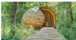
L'architecture et l'art au service de nouveaux usages, au cœur d'un grand site naturel à préserver.