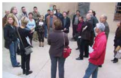
Visite à Crest

« QUEL POUVOIR DES COMMUNES POUR UNE POLITIQUE DE L'HABITAT ? »